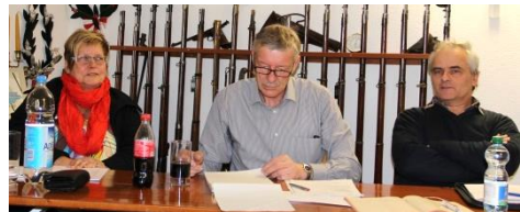
Vorstand Alte Garde 28.03.2015

Mit den Worten aus den Traueranzeigen und den guten Erinnerungen gedenken wir unseren im Jahre 2015 verstorbenen Kameraden.