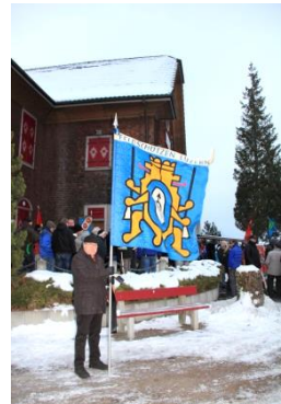
„Hilfsfähndrich“ am Winterausmarsch

Wie jedes Jahr danke ich meinen Vorstandskollegen und all jenen recht herzlich, die in irgendeiner Weise oder Funktion für unseren Verein tätig waren und damit zu einer unfallfreien Sportausübung beigetragen haben.