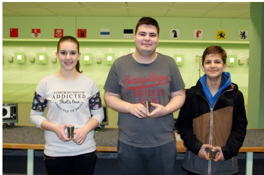
Nachwuchs Schlussmatch 21.01.2017