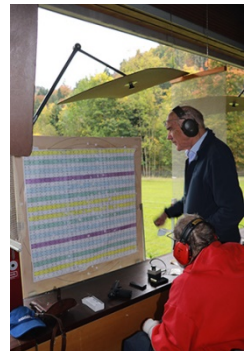
Kilbischiesen 2017: 1. Rang im Juxstich

uns, nicht zuletzt dadurch, in bester Erinnerung bleiben.